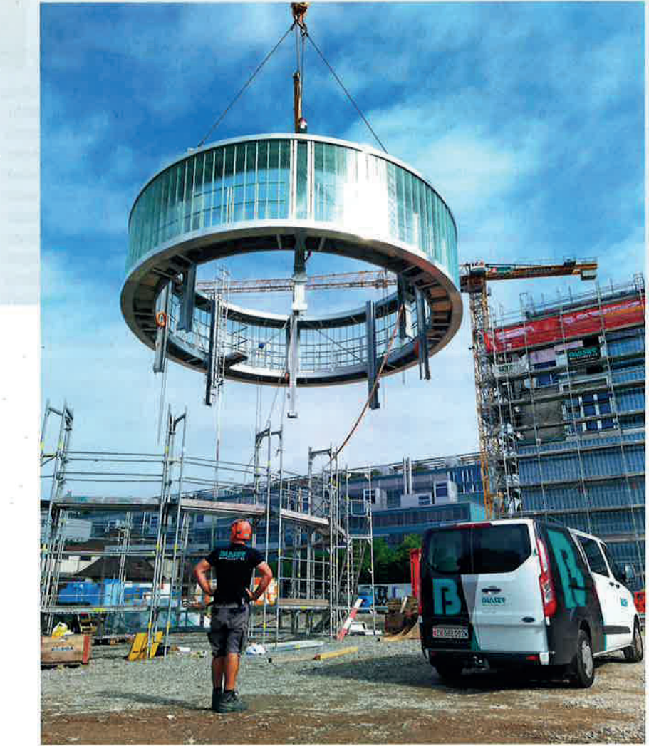
14 Tonnen an einem Lasthaken. Der zylinderförmige Kaminkranz wurde vor Ort am Boden komplett zusammengebaut.

Der Kaminkranz mit seiner zylindrischen Form weist einen Aussendurchmesser von 10,6 m und eine Höhe von 4,3 m auf. Den Kranhaken belastete er mit rund 14 Tonnen. Genutzt wird der Kaminkranz mit seinem Laufsteg aus-