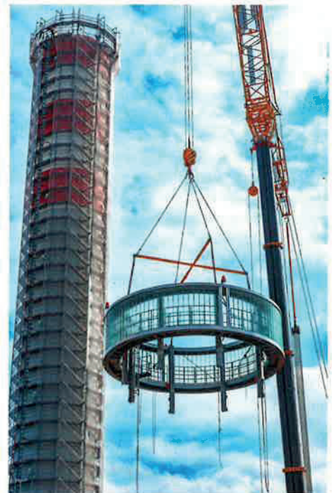
Die ruhige Hand des Kranführers und wenig Wind waren eine wichtige Voraussetzung für das Gelingen dieser Aktion. La réussite de cette action dépendait de la dextérité du grutier et de l'absence de vent.