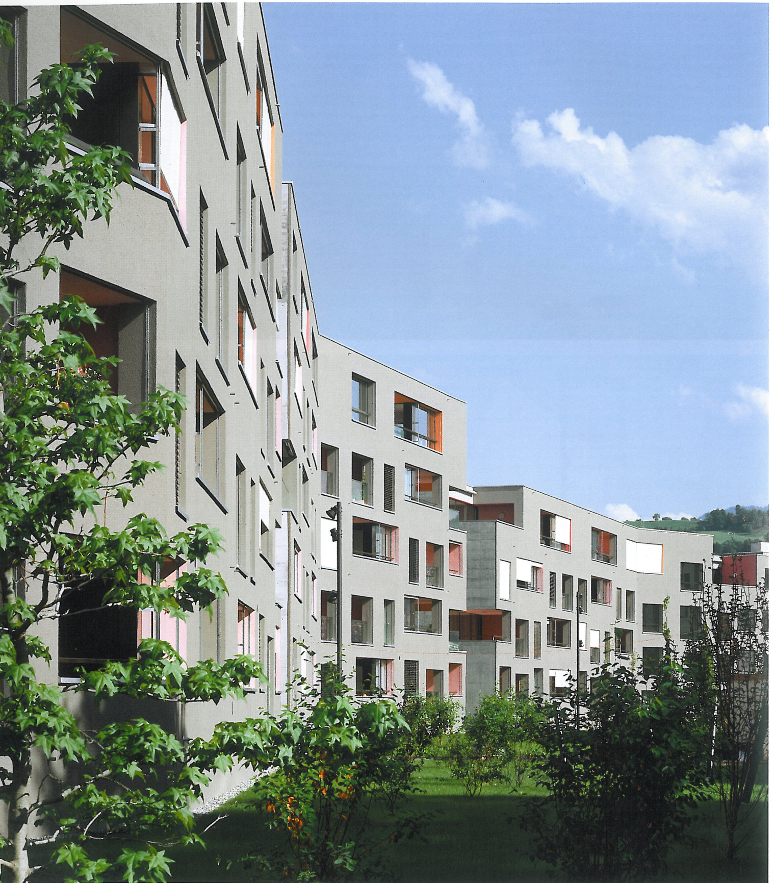
Grabner Pulver Architekten Wohnanlage in Baar, CH Residential complex in Baar, CH