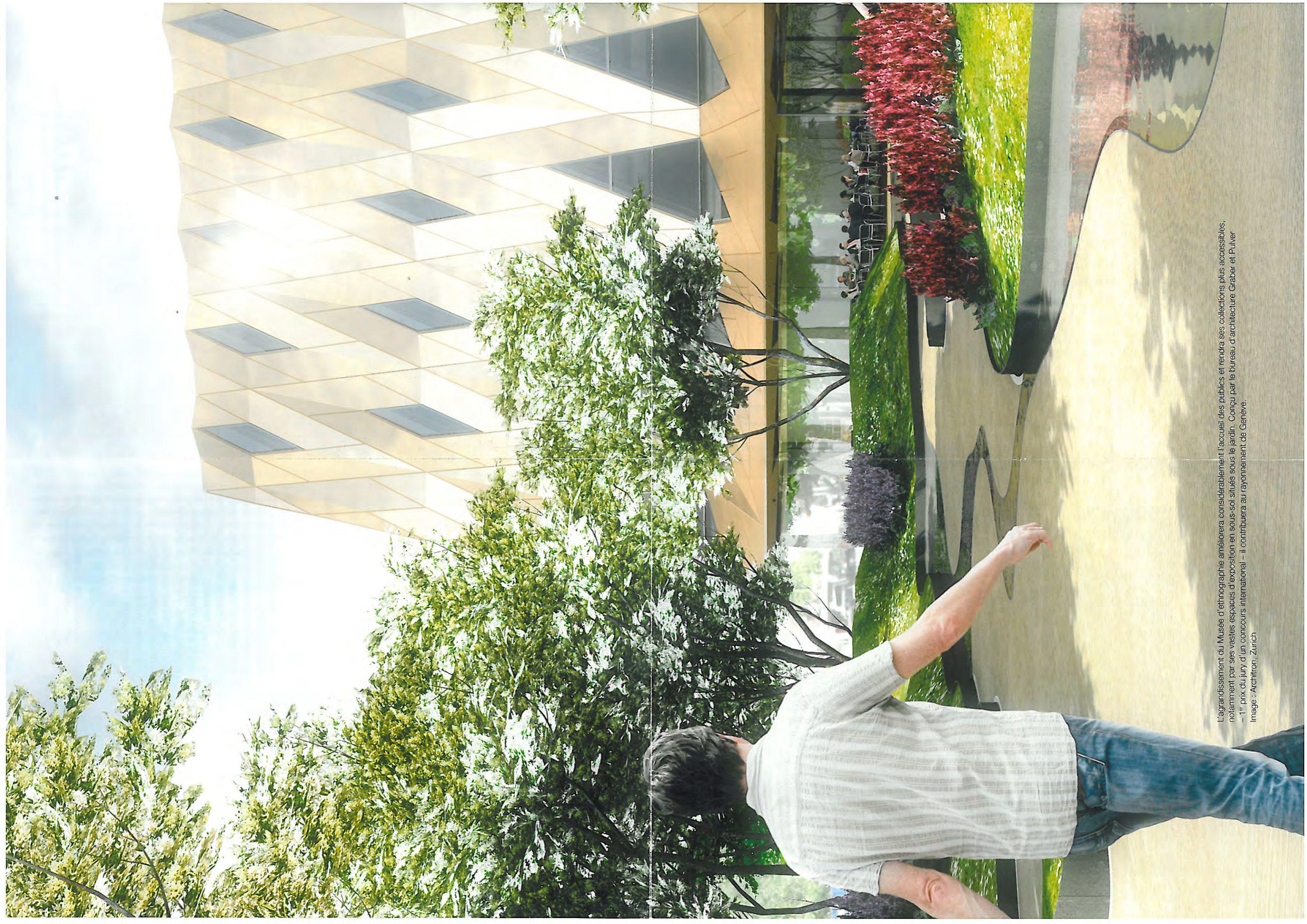
L'agrandissement du Musée d'ethnographie améliorera considérablement l'accueil des publics et rendra ses collections plus accessibles, notamment par ses vastes espaces d'exposition en sous-sol situés sous le jardin. Conçu par le bureau d'architecture Gräber et Pulver – 1 er prix du jury d'un concours international – il contribuera au rayonnement de Genève. Image : Archifron, Zurich