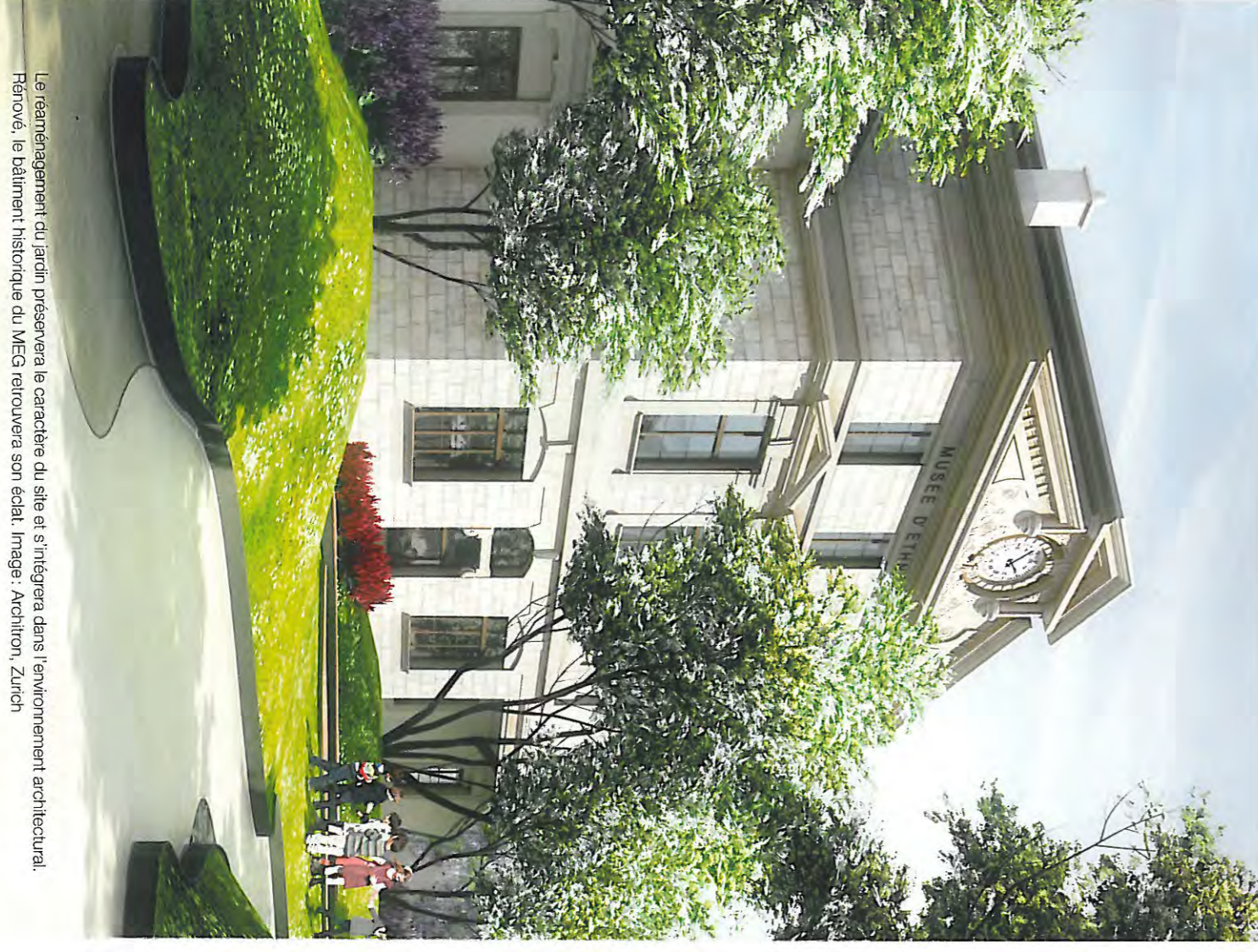
Le réaménagement du jardin préservera le caractère du site et s'intégrera dans l'environnement architectural. Rénové, le bâtiment historique du MEG retrouvera son éclat. Image : Architron, Zurich