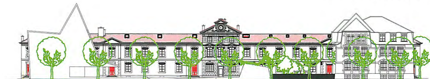
Boulevard Carl-Vogt. Façade sud-ouest du MEG, avec le nouveau bâtiment à gauche et l'école Carl-Vogt à droite