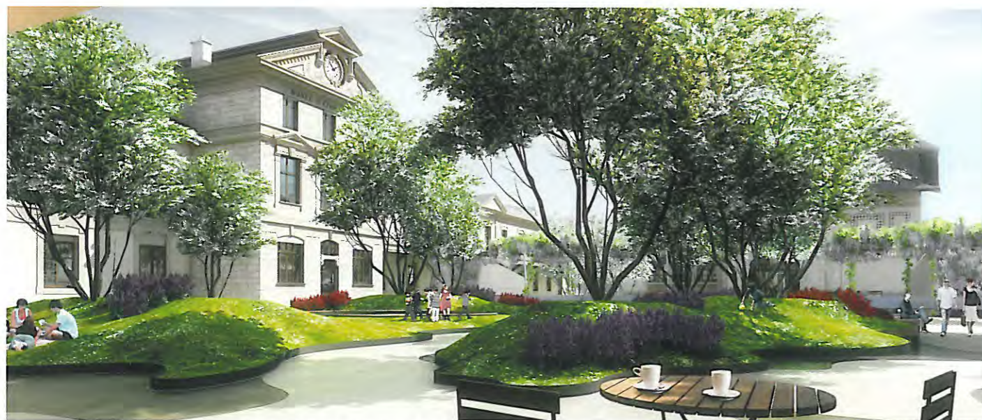
La terrasse du café du Musée offrira un cadre de verdure propice à la détente. Des amélanchiers, des cornouillers et des figuiers seront plantés.

Projet, état juillet 2010. Plans: Graber et Pulver Architekten, Zurich