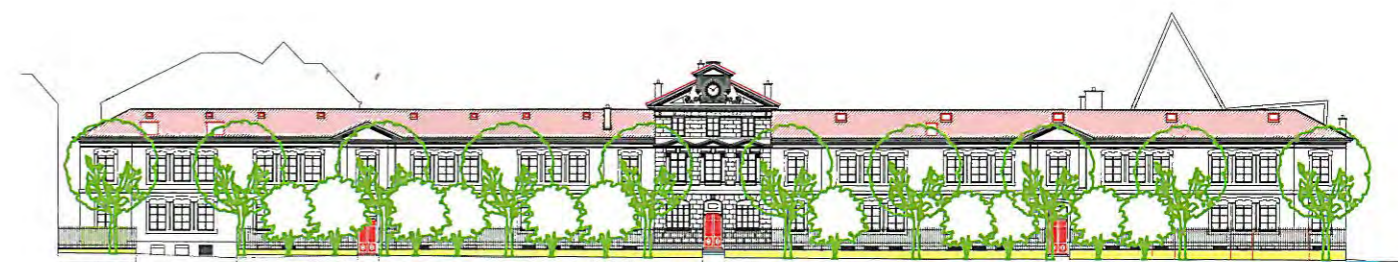
Rue des Maraîchers. Façade nord-est du MEG

L'agrandissement du Musée d'ethnographie représente une contribution notable au rayonnement de Genève. Sa collection est l'une des plus importantes de Suisse. Elle est reconnue sur le plan international. Des expositions conçues au Musée ont traversé le continent. « Le vodou, un art de vivre », créée en 2007, aura été présentée jusqu'en 2012 dans de prestigieux musées à Amsterdam, Göteborg, Berlin, Stockholm et Brême. Avec un Musée agrandi, ses conservateurs, chercheurs et collaborateurs pourront davantage exploiter leur savoir-faire muséologique et développer leurs compétences et ils contribueront ainsi au rayonnement de Genève en Suisse et à l'étranger.